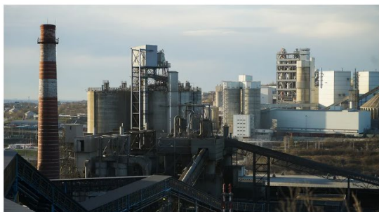
Инвестпроект стоимостью 22 млрд руб. предполагает создание производства мощностью 3,5 млн тонн цемента в год

Новороссийский цементный завод «Горный» судится с министерством природных ресурсов Кубани за право использовать водный объект Щель Сидоренкова, расположенный в горной части Новороссийска. Предприятие планирует реализовать в пределах спорной территории инвестпроект по строительству предприятия по производству цемента стоимостью 22 млрд руб. и мощностью 3,5 млн тонн продукции в год. Минприроды отказывается заключать с заводом договор водопользования на том основании, что информация о спорном объекте отсутствует в государственном водном реестре (ГВР). Ранее власти Новороссийска запретили обществу вырубать лес. После проигрыша дела в кубанском арбитражном суде НЦЗ «Горный» направил апелляционную жалобу. Шансы на отмену решения суда первой инстанции юристы оценивают по-разному.