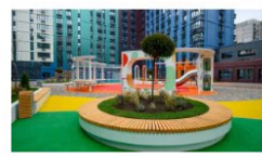
Партнерский материал ЮгСтройИнвест Квартал как искусство: в Ростове ГК «ЮгСтройИнвест» сдала первые дома в «Персоне» Ростовская 16 | ООО «ЮС ИМЭТ ДИ»