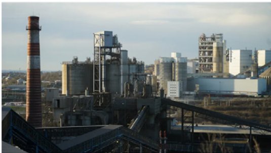
Инвестпроект стоимостью 22 млрд руб. предполагает создание производства мощностью 3,5 млн тонн цемента в год

Новороссийский цементный завод «Горный» судится с министерством природных ресурсов Кубани за право использовать водный объект Щель Сидоренкова, расположенный в горной части Новороссийска. Предприятие планирует реализовать в пределах спорной территории инвестпроект по строительству предприятия по производству цемента стоимостью 22 млрд руб. и мощностью 3,5 млн тонн продукции в год. Минприроды отказывается заключать с заводом договор водопользования на том основании, что информация о спорном объекте отсутствует в государственном водном реестре (ГВР). Ранее власти Новороссийска запретили обществу вырубать лес. После проигрыша дела в кубанском арбитражном суде НЦЗ «Горный» направил апелляционную жалобу. Шансы на отмену решения суда первой инстанции юристы оценивают по-разному.